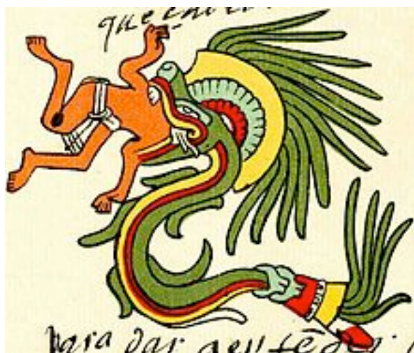
Quetzalcoatl - Codex Telleriano-Remensis

La transe m'engourdit et endort ma peur, je subis cela sans broncher.