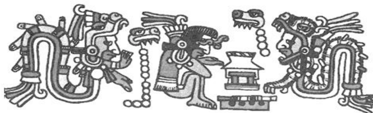
Codex Nuttall - Planche 19

La Pouliche Mars 2017 lavieestunecomédie.com